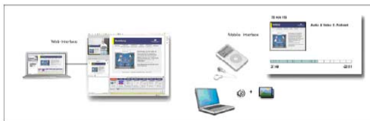
Abbildung 2: virtPresenter Vorlesungsaufzeichnungen auf verschiedenen Endgeräten

Abbildung 2 zeigt die fertigen Vorlesungsaufzeichnungen im Web Browser und auf einem Apple iPod.