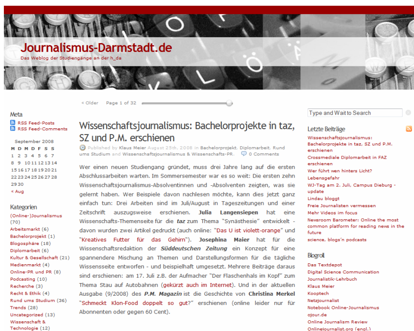
Abb. 2: Weblog der Hochschule Darmstadt

Beispielhaft sei hier auf das Hochschul-Blog der Hochschule Darmstadt verwiesen. Dort werden die Studiengänge Wissenschaftsjournalismus und Online-Journalismus angeboten. Bereits die inhaltliche Nähe der Studiengänge begründet die Verwendung von Technologien, die der Publikation im Internet dienen. Im Weblog der Hochschule werden entsprechend Trends und Entwicklungen in der Wissenschaftskommunikation und im Online-Journalismus aufgegriffen und diskutiert. Dozenten und Studierende aus den Journalismus-Studiengängen der Hochschule Darmstadt berichten von Studium und Campus-Leben.