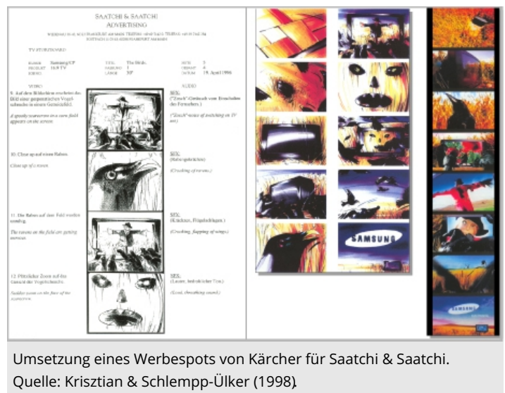
Umsetzung eines Werbespots von Kärcher für Saatchi & Saatchi.

Eine weitere Umsetzung erfolgt farbig in Markertechnik. Danach werden die Bilder eingescannt und durch Video/Audio erweitert.