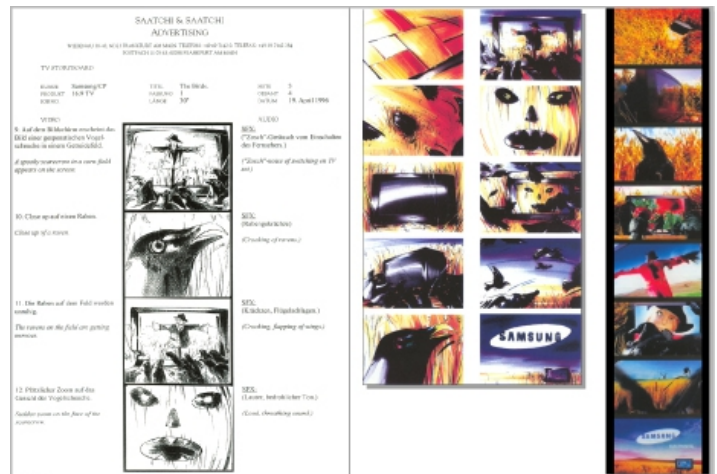
Umsetzung eines Werbespots von Kärcher für Saatchi & Saatchi.

Eine weitere Umsetzung erfolgt farbiger in Markertechnik. Danach werden die Bilder eingescannt und durch Video/Audio erweitert.