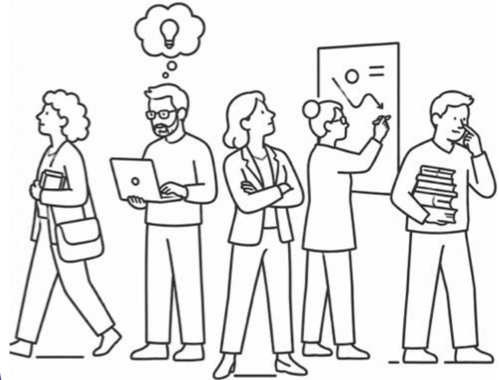
Abb. 3: Verschiedene Lehrpraktiken. KI-generiert mit ChatGPT; freigegeben unter CC0 1.0.