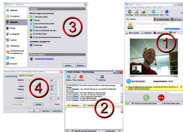
Abbildung 3: Skypes Oberfläche: (1) Videokonferenz, (2) Chat, (3) Optionen, (4) Videoeinstellungen

Weitere Informationen zu Skype erhalten Sie im Steckbrief im Portal.