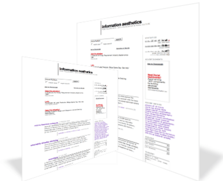
Abbildung 1: Screenshot information aesthetics

„Info-Aesthetics“, ein Begriff der von Lev Manovich geprägt wurde, bezeichnet neue Repräsentationsformen und -techniken, die mit digitalen Medien umgesetzt werden können und laut Manovich einen Katalysator der Informationsgesellschaft bilden.