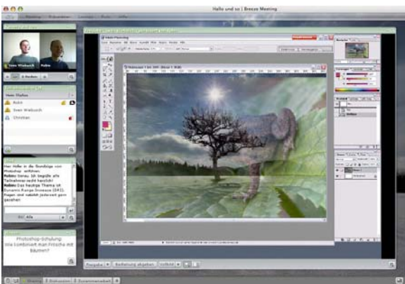
Abbildung 3: Breeze-Meeting mit freigegebener Anwendung (Adobe Photoshop)

In dieser Ausgabe möchten wir Ihnen Programme vorstellen, mit deren Hilfe Sie unter anderem Anwendungen auf dem Rechner Ihres Sitzungspartners fernsteuern und dadurch kollaborativ an Dokumenten arbeiten können (Application Sharing).