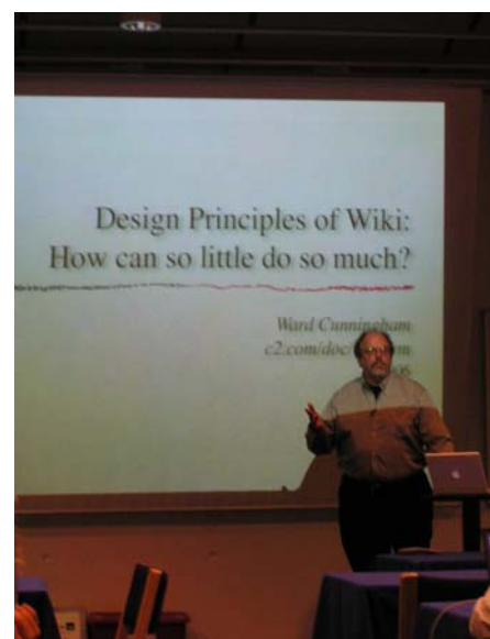
Abbildung 2: Vortrag von Ward Cunningham

http://www.wikisym.org/ws2006/proceedings/