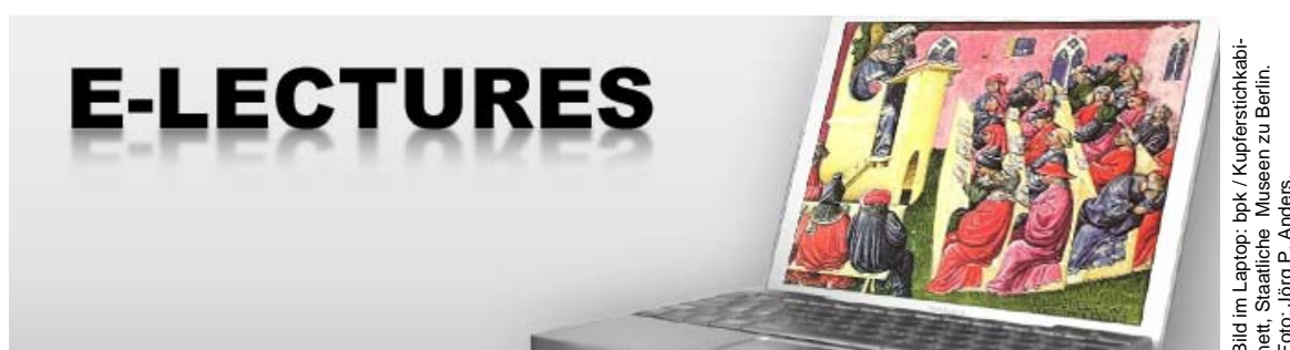
Bild im Laptop: bpk / Kupferstichkabinett, Staatliche Museen zu Berlin. Foto: Jörg P. Anders.

Die Vorlesung verändert sich: Synchroner Übertragungen, Veranstaltungsaufzeichnungen oder der parallele Einsatz von (asynchronen) Kommunikationstools auch in großen Teilnehmergruppen führen zu neuen Veranstaltungsszenarien – in denen sich z.B. die Studierenden die Inhalte im Selbststudium aneignen und Präsenzveranstaltungen zur Diskussion und Vertiefung genutzt werden. Im Special wird diese Umstrukturierung des Veranstaltungsablaufs ebenso thematisiert wie die damit verbundenen neuen Anforderungen an die Vor- und Nachbereitung und die technische Umsetzung.