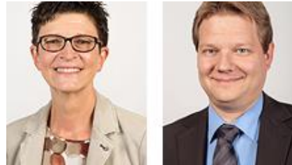
Sakia Esken (SPD, MdB), Sven Vollmering (CDU, MdB, angefragt), N. N. (KMK)

Die Teilnahme an den Online-Events ist kostenlos. Alle Veranstaltungen finden im Rahmen der e-teaching.org-Community statt, wo Sie auch weitere Informationen abrufen, sich einloggen sowie die Aufzeichnungen vergangener Events abrufen können.