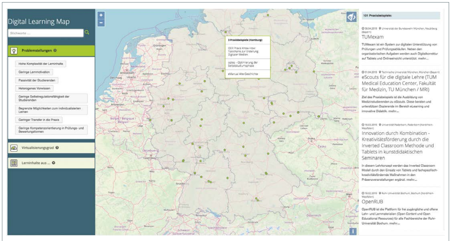
Abbildung 1: Startseite der Digital Learning Map.

Rahmendaten zu Projekttitel, konkreter Umsetzung, Schlüsselbegriffen und Fächergruppen, sowie zusätzliche Hinweise zum Beispiel auf Lernmaterial, die genutzten Tools und die Kontaktpersonen.